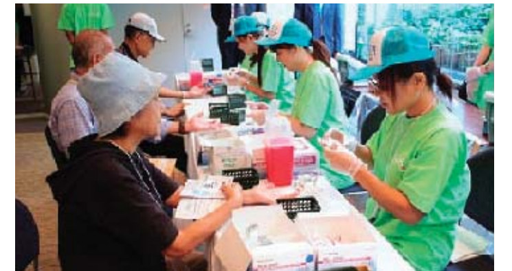
「ヘモグロビン・エー・ワン・シー認知向上運動」無料測定イベント