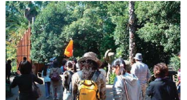
ウォーキングイベント