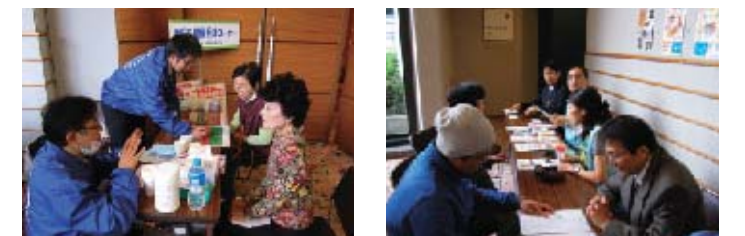
内科医と歯科医師登録医、コメディカルスタッフが連携して、療養相談会を開催しています。