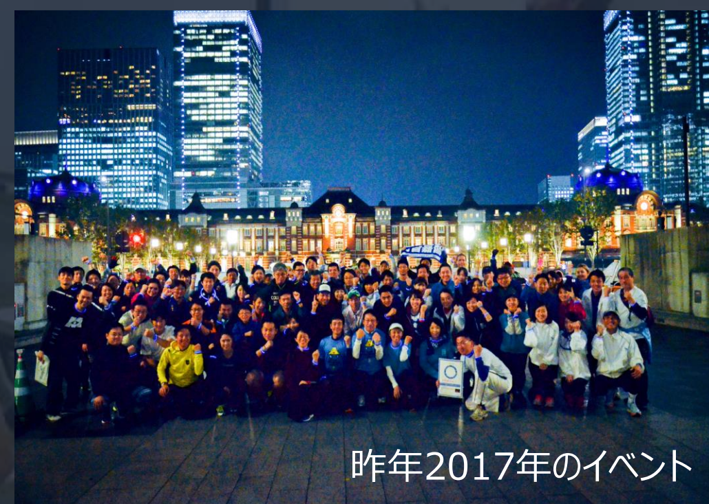
昨年2017年のイベント

世界糖尿病デー実行委員会、日本糖尿病協会、武田薬品工業株式会社は 昨年度（第1回：東京）に続き、11月14日にミニセミナーとスロージョギング®イベントを実施いたします。 2018年は会場を東京（皇居周辺）に加えて、大阪会場（大阪城）にも拡大、2拠点同時で開催します。 ブルーのケミカルライトブレスレットを身につけて走り、糖尿病予防の重要性をみなさんと伝えましょう！！