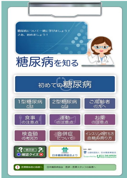
アプリ版「糖尿病を知る」トップページ